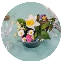
Une très jolie déco,