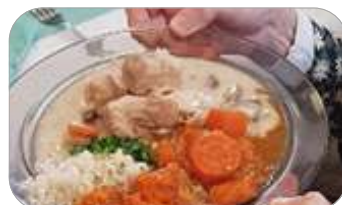
des petits plats mijotés,