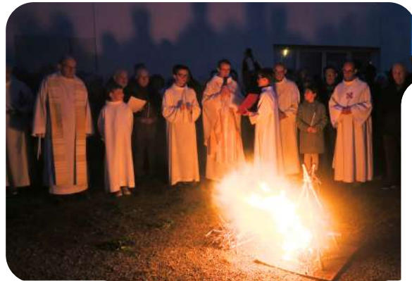
Veillée Pascale et baptême des catéchumènes