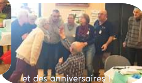
et des anniversaires !