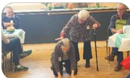
des rires, des mimes...