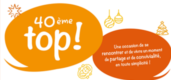
Table Ouverte Paroissiale

La paroisse Saintes Marthe & Marie entre Sèvres et Loire vous invite